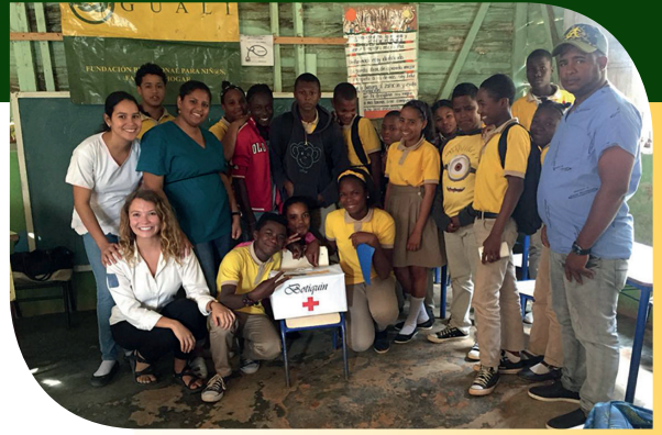
Leerlingen in Carratá krijgen les (eerste hulp bij ongevallen).

Er tekenen zich in de Dominicaanse Republiek enkele nieuwe tendensen af.