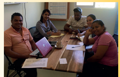
Het lokale Guali-team in vergadering