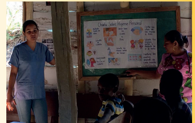
De doctoras geven les over persoonlijke hygiëne