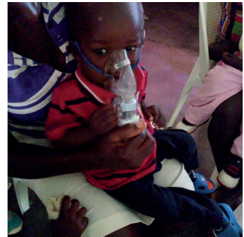
Specifieke medische hulp dankzij Fonds Viktor