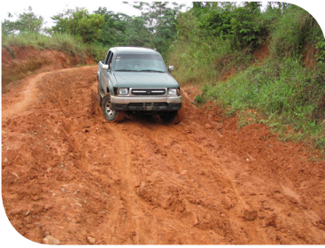
Wegdek in de Dominicaanse Republiek