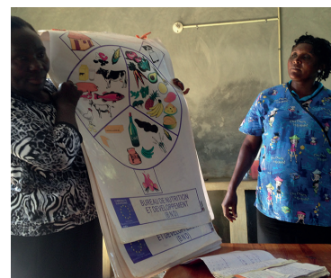
Les over evenwichtige voeding in Carice