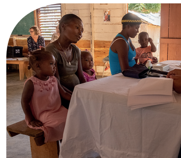
Raadpleging in Rincón