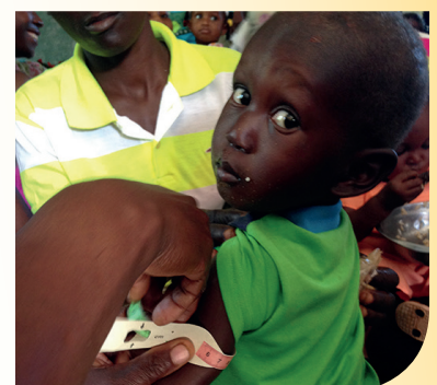
Metten van bovenarm bij ondervoede kinderen in Carice