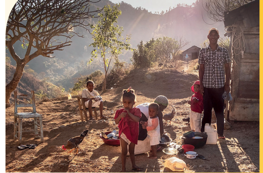
Wonen in een afgelegen dorpje

Lien: "Ook daar is nog werk aan de winkel voor de toekomst. Want de meeste patiëntjes die de gezondheidswerkers naar hem doorsturen, zijn ondervoede kinderen uit de bredere regio. Ondervoeding aanpakken is heel complex. Het vraagt een structurele oplossing op lange termijn. Maar deze groep kinderen heeft vandaag, nu, noodhulp nodig. Genoeg eten, voedingssupplementen, en een zeer goede opvolging. Daarvoor is geld en mankracht nodig."