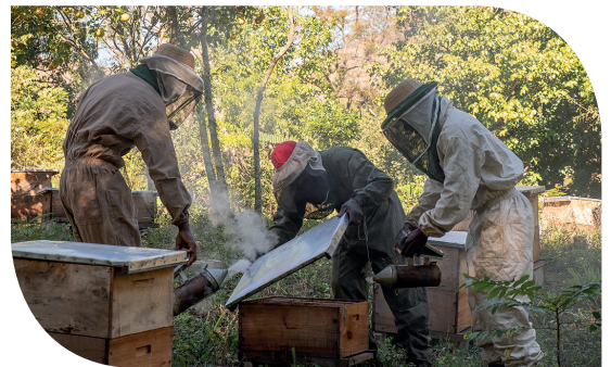
De inkers aan het werk