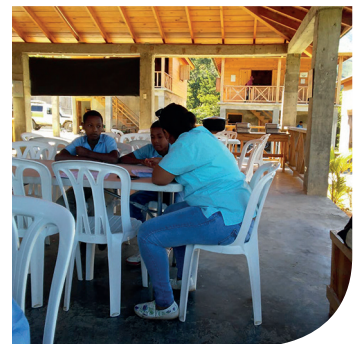
Medisch onderzoek in het internaat van Bartólo