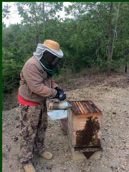
Werken met de bijen