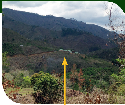
Internaat in Bartólo