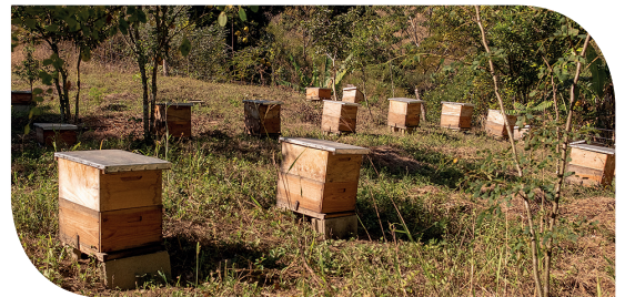
Bijenkasten in Los Jengibres

Alberto: "Wat de ontbossing betreft, zijn we op een kritiek punt beland. Het probleem dringt nu stilaan door bij de landbouwers, maar de structurele oplossingen overstijgen ieders draagkracht. En precies daarom is het belangrijk dat Guali ook op dit vlak actief blijft. De klimaatverandering zelf kunnen we niet oplossen. Dat vergt een krachtige wereldwijde aanpak. De arme families in de bergen zijn wel slachtoffer van de effecten van die klimaatopwarming. Samen met hen wil Guali zoeken naar activiteiten en landbouwmethodes die niet zo gevoelig zijn voor deze veranderingen, zoals boslandbouw of bijenteelt."