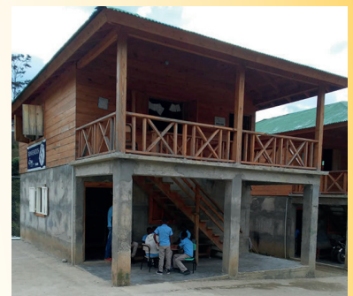
Internaat van Bartólo