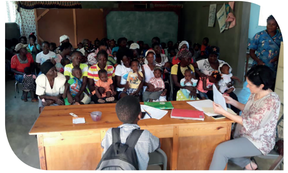
De kinderen van Via Lactea in Carice

"Het is ongelooflijk om te zien welke kracht in de Haïtiaanse mensen schuilt. Bij een terreinbezoek dit jaar was ik ontroerd, toen ik de vormingswerksters aan het werk zag en hoorde. Trouw aan hun cultuur, hadden ze een swingend lied gemaakt, dat ze enthousiast zongen met alle moeders en grootmoeders, waarvan de meerderheid niet kan lezen of schrijven. Het lied vertelt over de voedingswaarde van verschillende levensmiddelen en over wat je thuis kunt doen als je kind ondervoed dreigt te worden. Vele strofen - vol hoop."