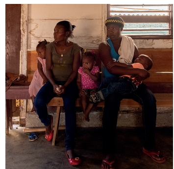
Geduldig wachten in de wachtzaal