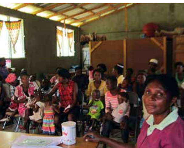
Voedingsprogramma Via Lactea