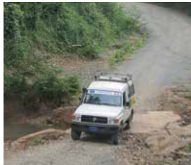
On the road ...